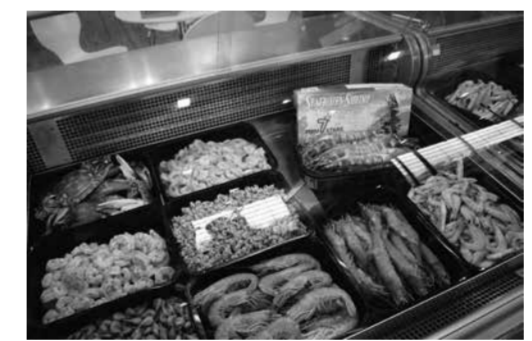
★ Het garnalenassortiment van Kegge/Primstar.