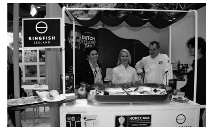
★ Ook Kingfish Zeeland gaf acte de presence op de Duitse beurs. Uiteraard voor het eerst; de kwekerij in het Zeeuwse Kats wordt op vrijdag 6 april pas officieel geopend. Het product, de gekweekte kingfish, is echter al op de markt.