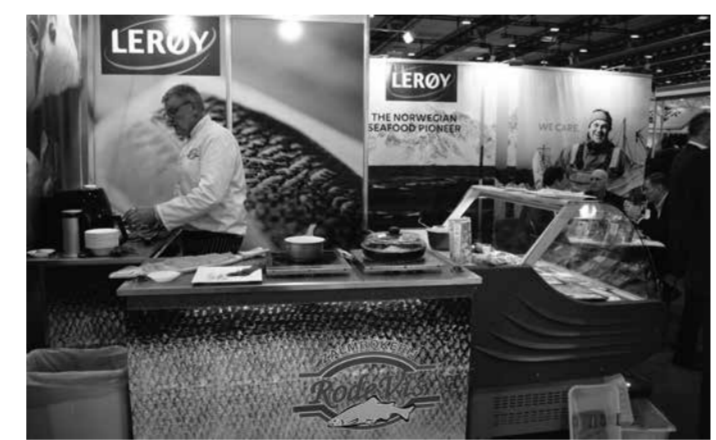
★ Zalm proeven in de stand van Rodé Vis uit Urk en het Noorse moederbedrijf Leroy.