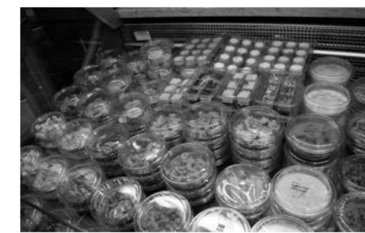
★ Het tapas-assortiment van Haasnoot/Polaris.

In de stand van Haasnoot kunnen de bezoekers vers gesneden haring proeven. Ook vindt er een test plaats met een nieuw product: haringpaté in verschillende smaken, waaronder bosbes-mierikswortel, curry-mango-chili en mediterraan. De reacties van de bezoekers die proeven zijn positief. Dochter-