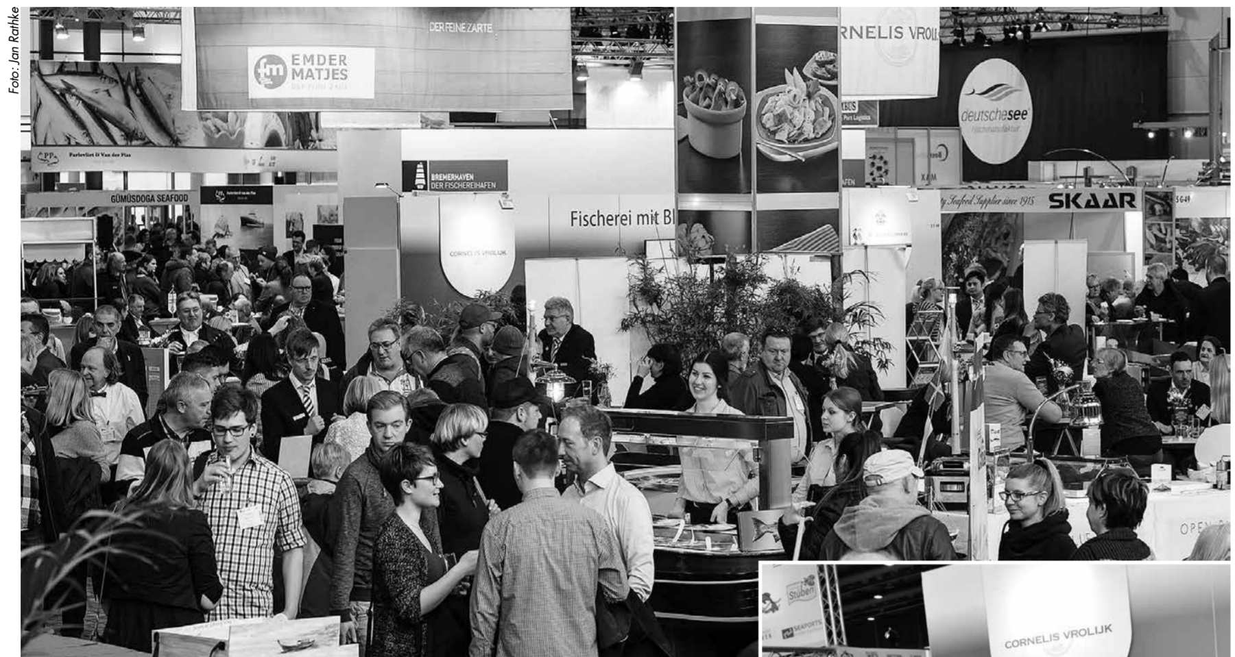
★ De openingsdag, de zondag, is altijd de drukste dag voor Fish International.