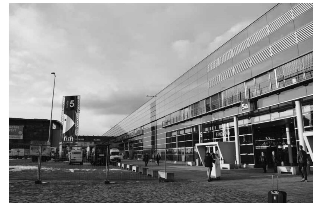
★ Plaats van handeling: het beursgebouw in Bremen.