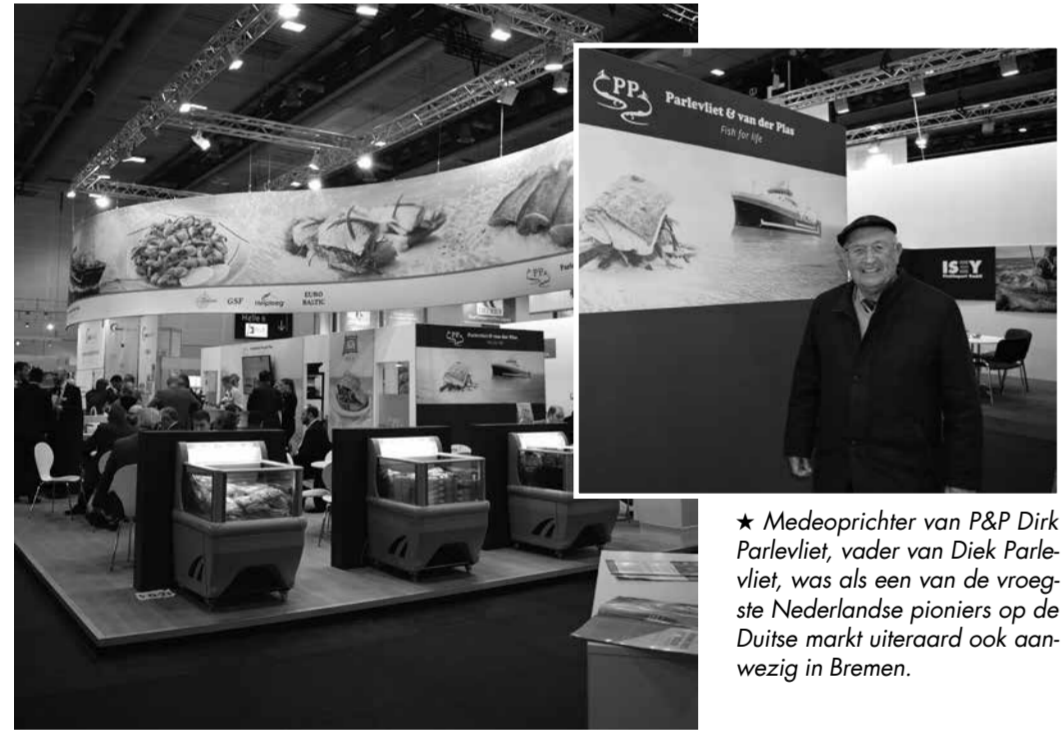
★ Drukte in de stand van Parlevliet & Van der Plas.